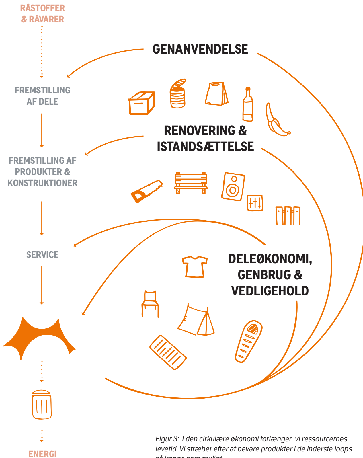
Figur 3: I den cirkulære økonomi forlænger vi ressourcernes levetid. Vi stræber efter at bevare produkter i de inderste loops så længe som muligt.